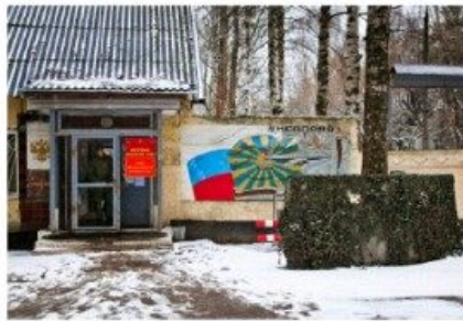
ПАМЯТНЫЙ ЗНАК «15 лет со дня эвакуации в Арциво»

Но прошло где-то около 4-х часов полёта, самолёт снизился до высоты 600 метров, командир отключил автопилот, принял управление на себя и мы удачно приземлились. Поблагодарили (устно) пилотов за доставку нас на родную землю, они показали, в какую сторону следует идти к ж.д. вокзалу.