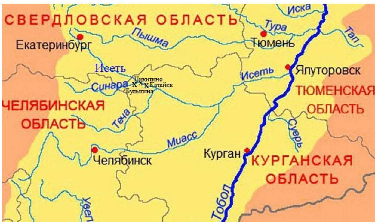
Карта бассейна Исети и Синары

Родился я в 1938 году и до семи лет жил там, где и родился, т.е. в деревне Бульгина, что в Курганской области. Сама деревня располагалась на правом берегу р.Синара, которая через 2,5 – 3 км перед с.Никитинское впадает в более крупную р.Исеть. Почему пишу «располагалась», потому что её уже давно нет. Не знаю, когда конкретно возникла деревня, но знаю, когда она исчезла. Из архивных документов в общих чертах известно, когда, кем и как были заселены бассейны рек Исети и Синары.