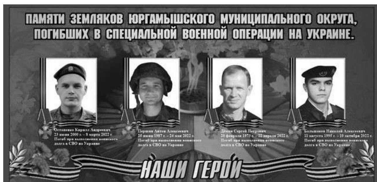
Баннер на въезде в поселок Юргамыш

Герои не умирают, они живут вечно. Ведь их жизнь после смерти не материальная, а вечная. Не надо искать еще какие-то ценности, мы их давно нашли и определили, пришло время называть все своими именами. Защищая духовность, справедливость, нашу культуру, мы защищаем Святую Русь и ее будущее. «Нет больше той любви, чем положить душу за други своя», – говорится в Евангельском Слове Христа. К этому призыван каждый человек, это есть почитание подвига каждого гражданина за общество, за народ.