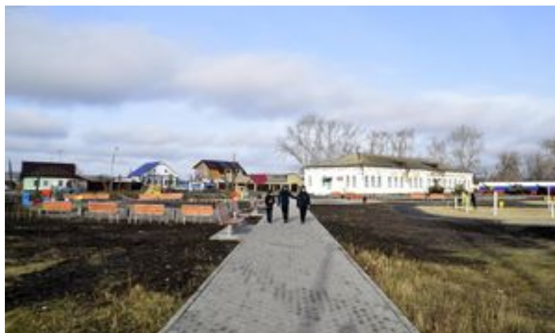
Дорожка к Базовой школе. Школьники её уже осваивают.