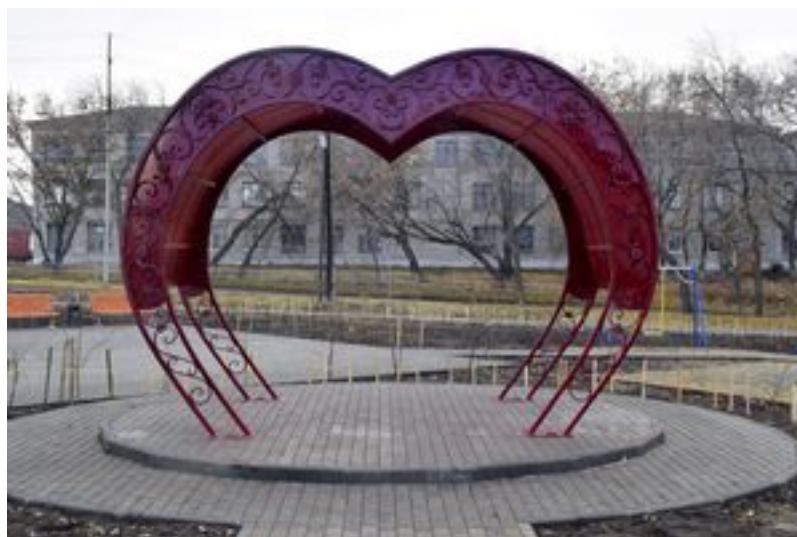
Беседка для влюблённых