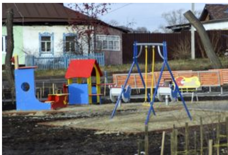
Ещё одна детская площадка