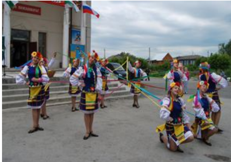
Районный дом культуры. Танцует «Вектор»