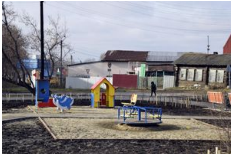
Ещё одна детская площадка. Для самых младших