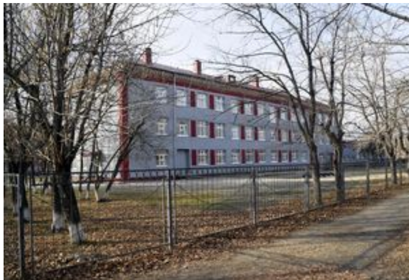
Школа №1. Красавица. В наше время её ещё не было.