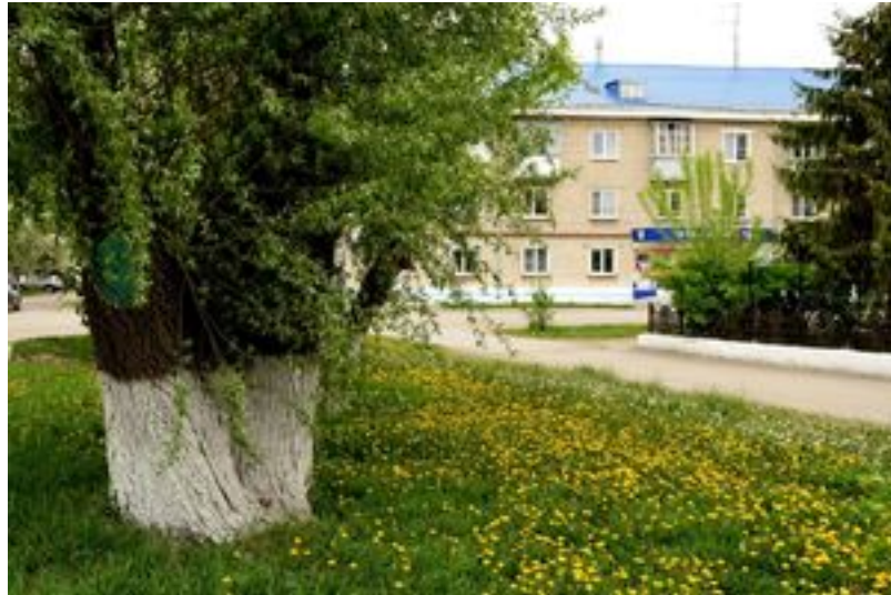
Весна в городе