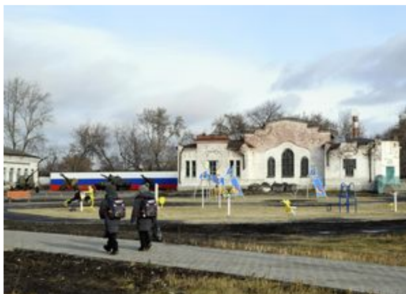
В щколу через парк