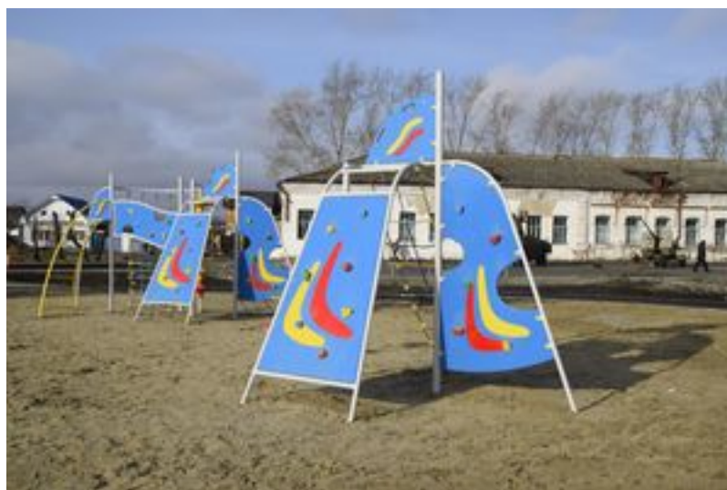
Площадка для маленьких скалолазов

А вот совсем новые фотографии, которые просто нельзя обойти вниманием! Это фотографии начала нового Молодёжного парка.