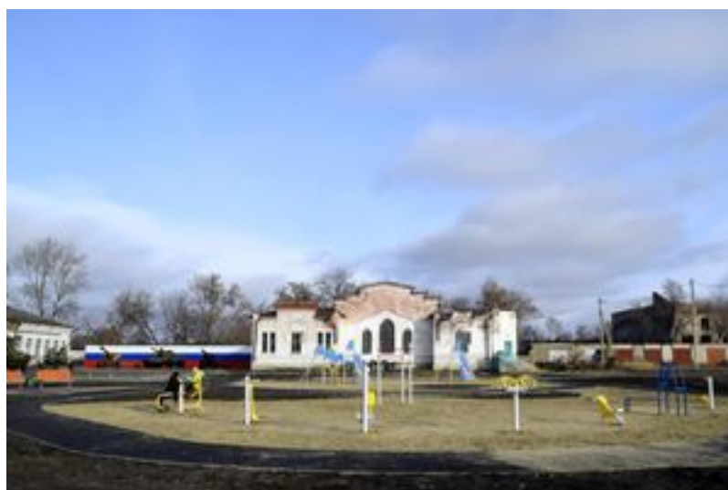
Площадка в стадии оборудования