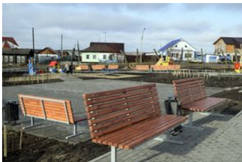
В парке будет более 30 скамеек для отдыха