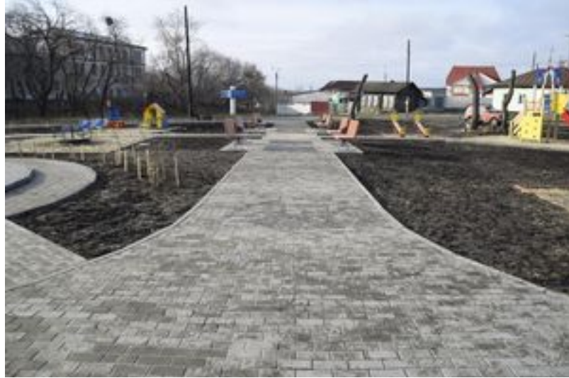
Аллея для прогулок. По сторонам будут деревья и клумбы цветов