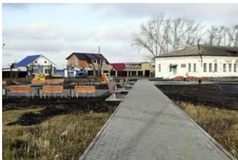
Дорожка для прогулок