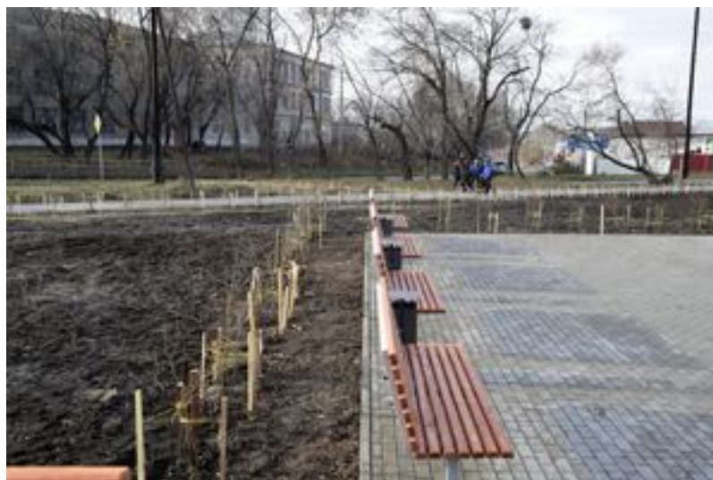
Площадка для отдыха в окружении будущих деревьев