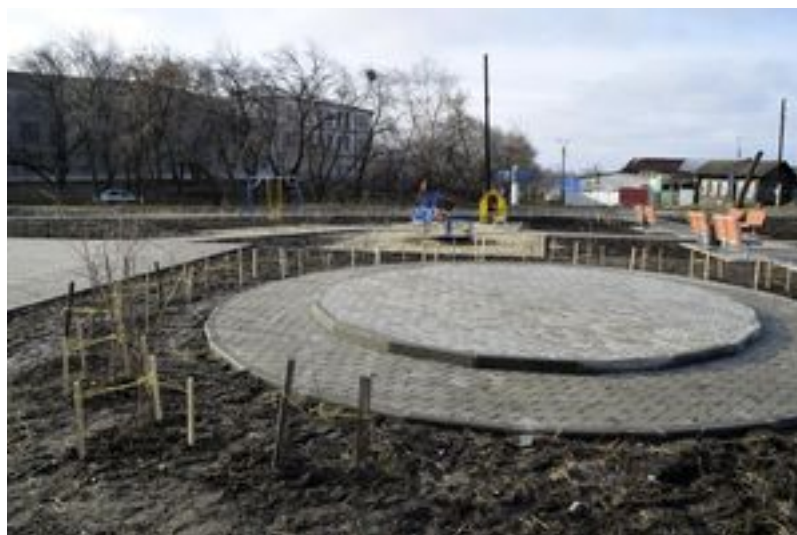
Здесь будет беседка для влюблённых