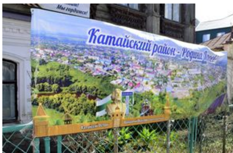
Панорама города. Установлена возле районного краеведческого музея. Красиво и познавательно!