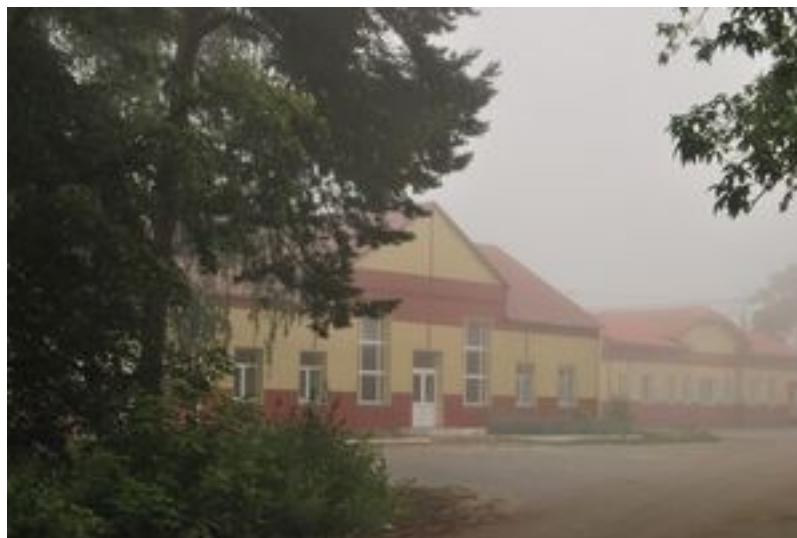
А вот и он. Выплывает из тумана.