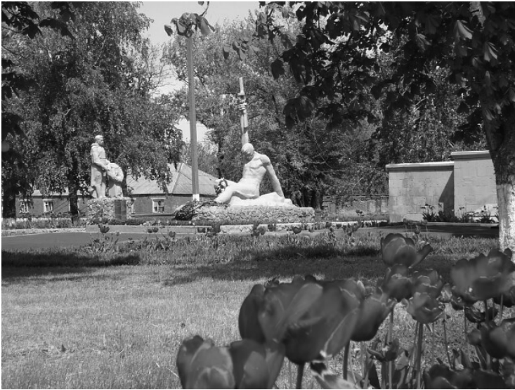
Мемориальный сквер в с. Марьевка